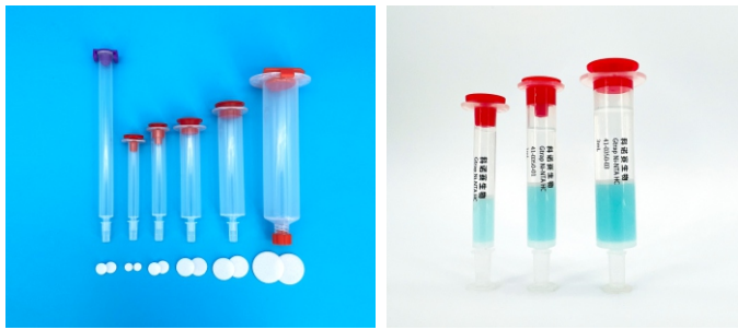
图1. 蛋白纯化重力柱(左空柱 右Gtrap Ni-NTA)

科诺赛生物可提供 Ni-NTA/IDA/TED、Protein A、Protein G、4B/6B、CL4B/CL6B、4FF/6FF等各种层析介质装填的重力柱, 操作简单便捷、纯化效率高, 主要应用于重组蛋白、抗原抗体、DNA及DNA结合蛋白、核酸等物质的分离纯化。